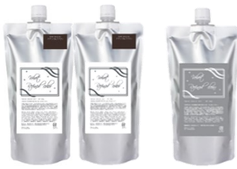
ラベル色 カラー剤…白、クリア…ライトグレー